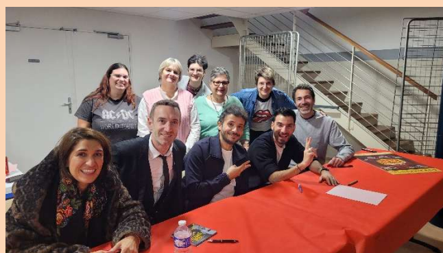
EUX & NOUS !